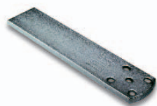
PLA6 aanlaslip lengte 250 mm Stuks/verpak.: 1