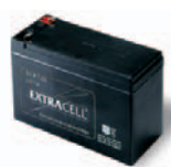
B12-B batterijen 12 V 6 Ah. Accessoires voor TO4024 Stuks/verpak.: 1