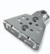
PLA15 afstelbare op te schroeven voorbeugel Stuks/verpak.: 2