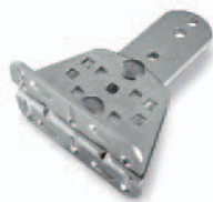
PLA14 afstelbare op te schroeven achterbeugel Stuks/verpak.: 2