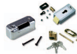
PLA11 horizontaal 12 V-elektrisch slot (verplicht voor vleugels langer dan 3 m) Stuks/verpak.: 1