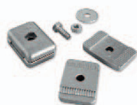
PLA13 mechanische eindaanslagen voor open en gesloten stand Stuks/verpak.: 4