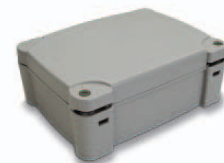
BA3-A Nice kastje voor batterijen. Accessoires voor TO4024

De op deze brochure voorkomende gegevens vormen slechts een indicatie. RDA behoudt zich het recht voor tederer gewenste wijziging die zij nuttig acht aan haar producten aan te brengen. Foto ter illustratie