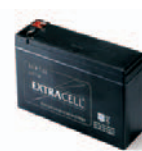
B12V-C batterijen 12 V 2 Ah. Accessoires voor TO4024 Stuks/verpak.: 1