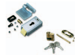
PLA10 verticaal 12 V-elektrisch slot (verplicht voor vleugels langer dan 3 m) Stuks/verpak.: 1