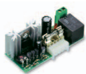
CARICA insteekkaart voor het opladen van batterijen. Accessoires voor TO4024 Stuks/verpak.: 1